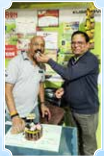
Goodluck Auto Care, Pune (Maharashtra)