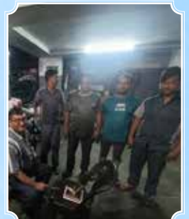
सिंघा एंड संस, कोलकाता (पश्चिम बंगाल)