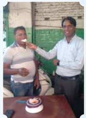
Vinay Hero Honda Service Centre, Deogharh (Jharkhand)