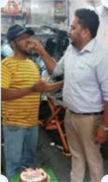
Karnataka Motors, Bangalore (Karnataka)