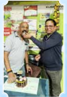
गुडलक ऑटो केयर, पुणे (महाराष्ट्र)