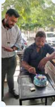
ऋद्धि सिद्धि ऑटो रिपेयर, मानसरोवर (जयपुर)