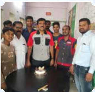
दीपाली ऑटोकेयर, सांगली (महाराष्ट्र)