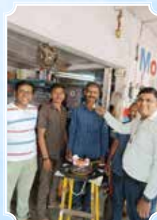
Samarth Auto Service Point, Ahmednagar (Maharashtra)