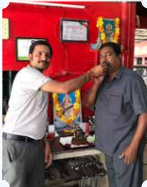
कार क्लिनिक, थिरयोर (केरल)