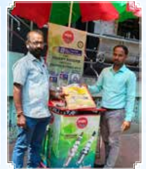
Vizag (Andhra Pradesh)