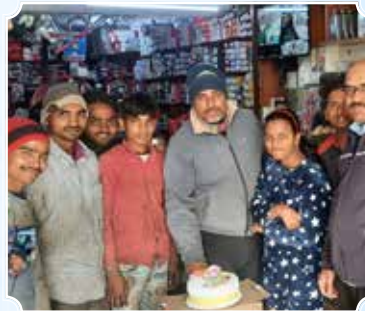
Sharma Auto Center, Rohini (Delhi)