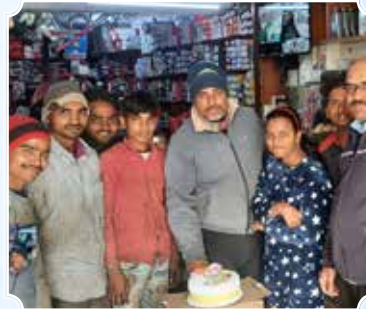
शर्मा ऑटो सेंटर, रोहिणी (दिल्ली)