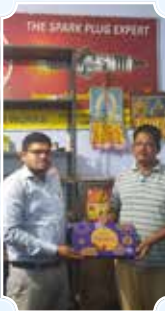
Prusty Auto Workshop, Khurda (Odisha)