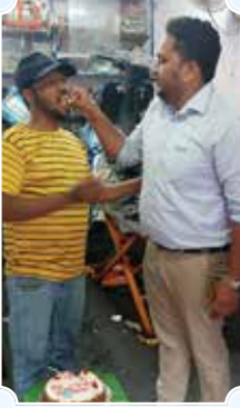
कर्नाटक मोटर्स, बँगलोर (कर्नाटक)