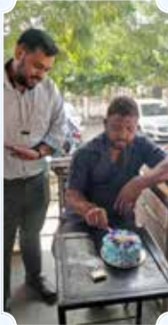
Ridhi Sidhi Auto Repairs, Mansarovar (Jaipur)