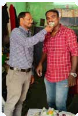
Kareemulla Auto Care, Visakhapatnam (Andhra Pradesh)