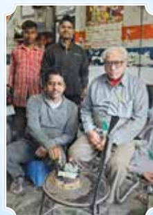
New Kamalia Auto Centre, Ludhiana (Punjab)