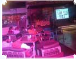
मेरठ (उत्तर प्रदेश)