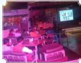
Meerut (Uttar Pradesh)