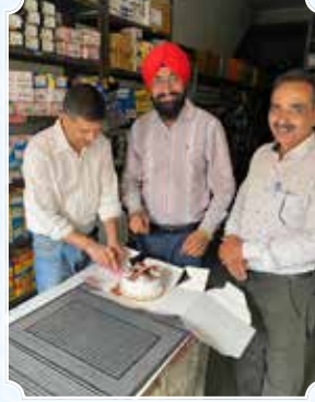
एवन बाइक प्वाइंट, जालंधर (पंजाब)