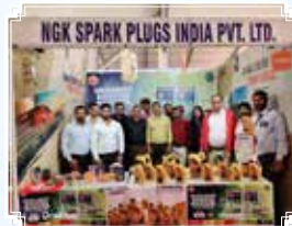
कानपुर (उत्तर प्रदेश)