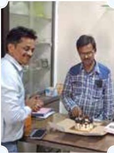
पाटिल ऑटोमोबाइल्स, इंदोर (मध्य प्रदेश)