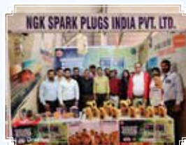
Kanpur (Uttar Pradesh)