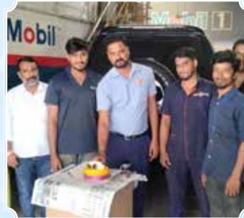
आरएनएस मोटर्स, कुकटपल्ली, हैदराबाद (तेलंगाना)