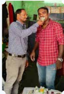
करीमुल्ला ऑटो केयर, विशाखापत्तनम (आंध्र प्रदेश)