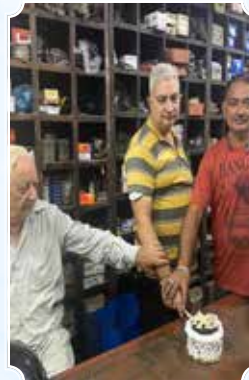
बिल्ला वोल्केनाइजिंग एंड साइकिल वर्क्स, अमृतसर (पंजाब)