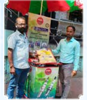
विजाग (आन्ध्र प्रदेश)