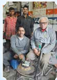
न्यू कमालिया ऑटो सेंटर, लुधियाना (पंजाब)