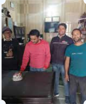
Batra Motors, Ghaziabad (Uttar Pradesh)