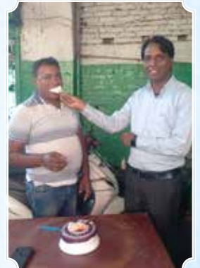
विनय हीरो होंडा सर्विस सेंटर, देवघर (झारखंड)