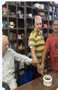
Billa Volcanising & Cycle Works, Amritsar (Punjab)