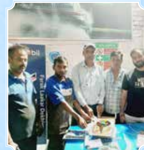
स्माइलेक्स ऑटोमोबाइल्स 4डब्ल्यू, गुडगांव (हरियाणा)