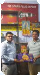
प्रस्टी ऑटो वर्कशॉप, खुर्दा (ओडिशा)