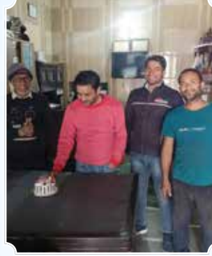
बत्रा मोटर्स, गाजियाबाद (उत्तर प्रदेश)