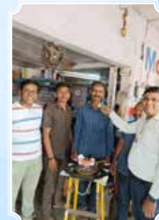
समर्थ ऑटो सर्विस पॉइंट, अहमदनगर (महाराष्ट्र)