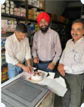
Avon Bike Point, Jallandar (Punjab)