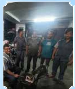
Singha And Sons, Kolkata (West Bengal)