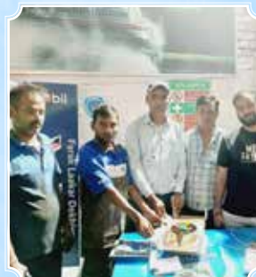
Smilex Automobiles 4W, Gurgaon (Haryana)