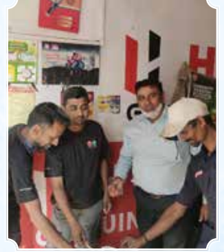
बाइक प्वाइंट, कामरेज, सूरत (गुजरात)