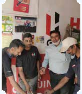
Bike Point, Kamrej, Surat (Gujarat)