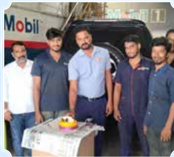
RNS MOTORS, Kukatpally, Hyderabad (Telangana)