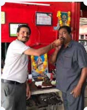
Car Clinic, Thissure (Kerala)