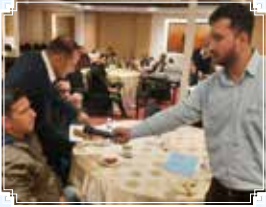
जम्मू (जम्मू एवं कश्मीर)