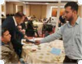
Jammu (Jammu & Kashmir)