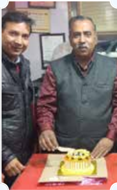
Kamal Auto Service, Ambala Cantt. (Haryana)