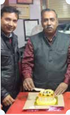
कमल ऑटो सर्विस, अंबाला कैंट (हरियाणा)