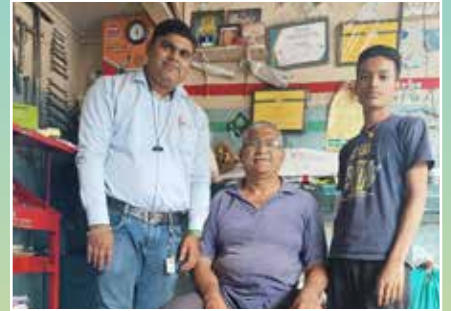
Nair Auto Works, Pune (Maharashtra)