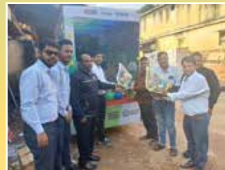
2W Distributor - Shree Balaji Auto Distributors Pvt. Ltd. Kolkata (West Bengal)