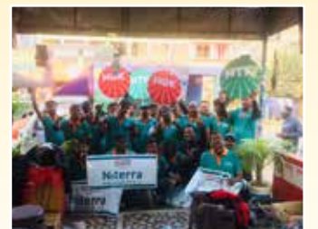
पश्चिमी मिदनापुर (पश्चिम बंगाल)