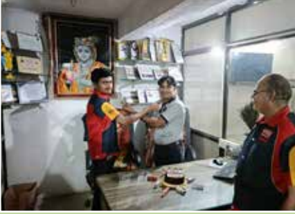
जयरज ऑटो सर्विस पॉइंट – तलाजा (गुजरात)