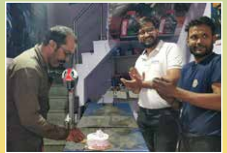
Ravi Auto Expert, Jaipur (Rajasthan)