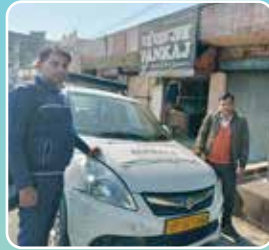
Saharanpur (Uttar Pradesh)