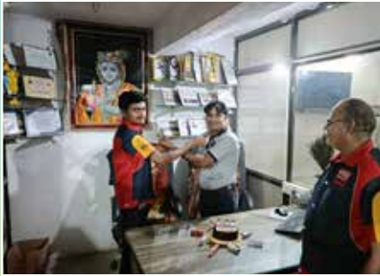
Jayraj Auto Service Point - Talaja (Gujarat)