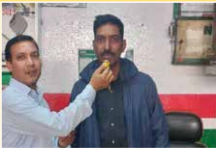
Sri Balaji Auto Repairs, Sirsa (Haryana)