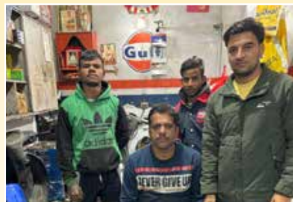
New Kamalia Auto Centre, Ludhiana