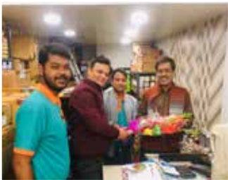
4W डिस्ट्रीब्यूटर - ओरिएंट मोटर स्टोर्स, कोलकाता (पश्चिम बंगाल)