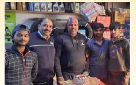
शर्मा ऑटो सेंटर, दिल्ली