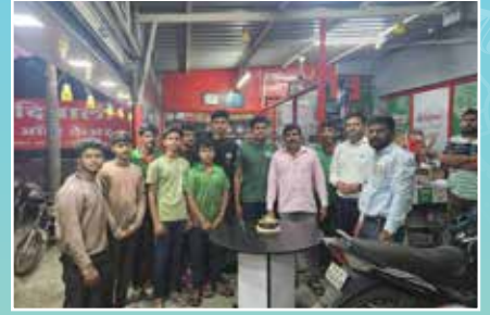
Deepali Auto care, Sangli (Maharashtra)