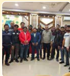
Lucknow (Uttar Pradesh)