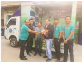
2W डिस्ट्रीब्यूटर - अंकित ऑटो डिस्ट्रीब्यूटर्स, कोलकाता (पश्चिम बंगाल)