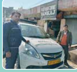
सहारनपुर (उत्तर प्रदेश)