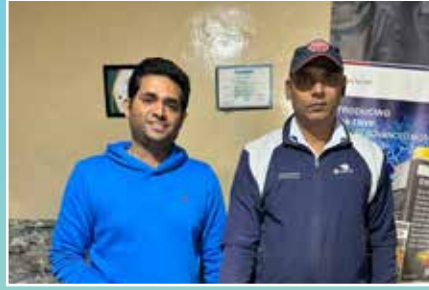
C.N.G Nation, Gurugram