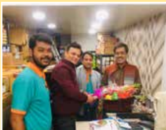
4W Distributor - Orient Motor Stores, Kolkata (West Bengal)