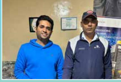
सी.एन.जी. नेशन, गुरुग्राम