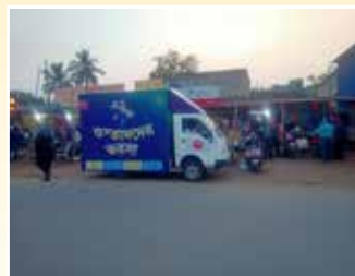
दुर्गापुर (पश्चिम बंगाल)