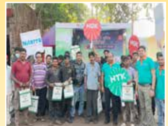
Asansol (West Bengal)