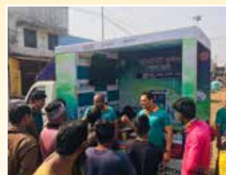
East Midnapore (West Bengal)