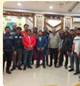
लखनऊ (उत्तर प्रदेश)