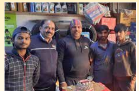
Sharma Auto Centre, Delhi