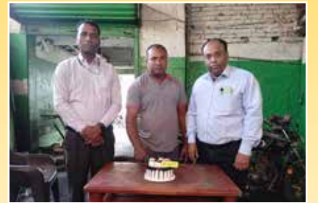
विनय हीरो होंडा सर्विस सेंटर, देवघर (झारखंड)