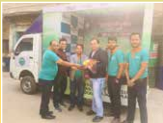
2W Distributor - Ankit Auto Distributors, Kolkata (West Bengal)