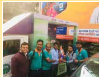
4W Distributor - Topsel Marketing Pvt. Ltd., Kolkata (West Bengal)