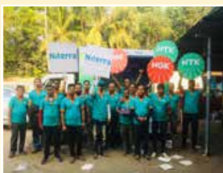
Bongaon (West Bengal)