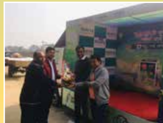
2W Distributor - Vidira Innovations Pvt. Ltd., Bardhaman (West Bengal)