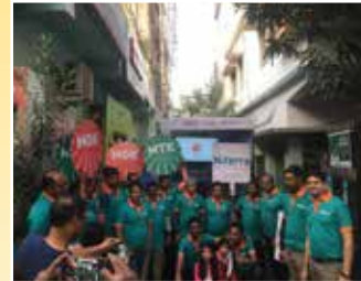
आरामबाग (पश्चिम बंगाल)