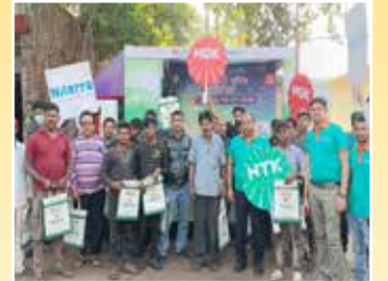
आसनसोल (पश्चिम बंगाल)