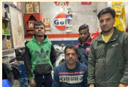
न्यू कमालिया ऑटो सेंटर, लुधियाना