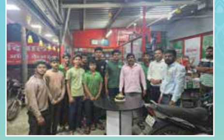
दीपाली ऑटो केयर, सांगली (महाराष्ट्र)