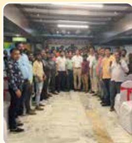
Katni (Madhya Pradesh)