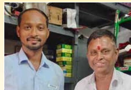
Sri Shankar Srinivasa Automobiles Vizianagaram (Andhra Pradesh)