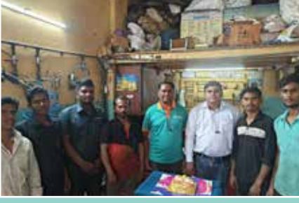
बादशाह होंडा सर्विस सेंटर, सोलापुर (महाराष्ट्र)