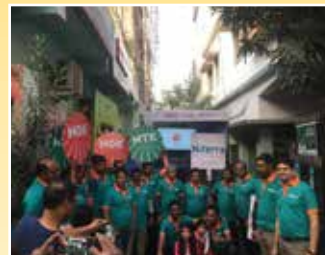
Aarambagh (West Bengal)