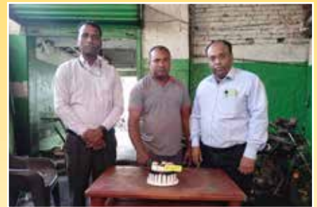
Vinay Hero Honda Service Centre, Deoghar (Jharkhand)