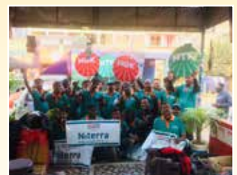
West Midnapore (West Bengal)