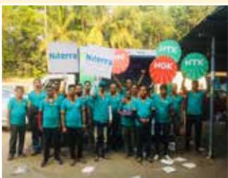
बनगांव (पश्चिम बंगाल)