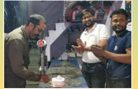
रवि ऑटो एक्सपर्ट, जयपुर (राजस्थान)