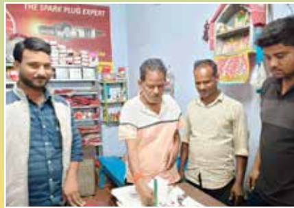
Prusty Auto Workshop, Khurda (Odisha)