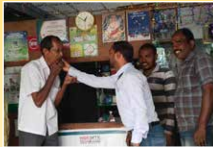
श्री जया प्रकाश लक्ष्मी मोटर वर्क्स विजयनगरम (आंध्र प्रदेश)