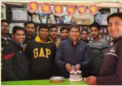
New S.P Motors, Ghaziabad (U.P.)