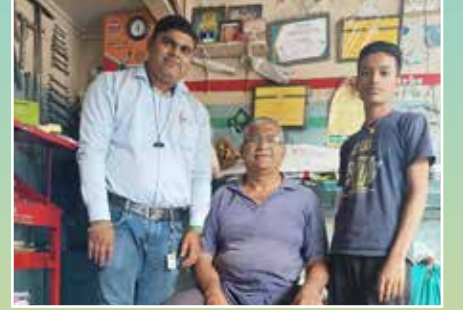
नायर ऑटो वर्क्स, पुणे (महाराष्ट्र)