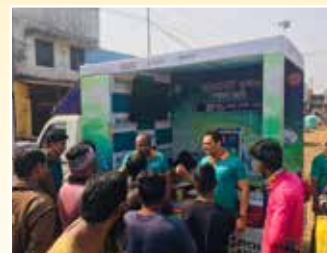
पूर्वी मिदनापुर (पश्चिम बंगाल)