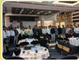
Indore (Madhya Pradesh)