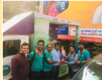
4W डिस्ट्रीब्यूटर - टॉपसेल मार्केटिंग प्राइवेट लिमिटेड, कोलकाता (पश्चिम बंगाल)