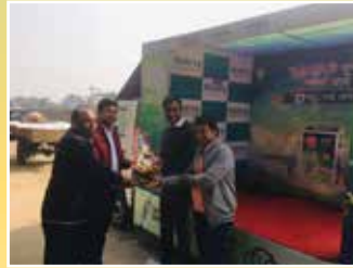
2W डिस्ट्रीब्यूटर - विदिरा इनोवेशन प्राइवेट लिमिटेड, बर्धमान (पश्चिम बंगाल)