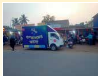
Durgapur (West Bengal)