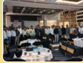
इंदौर (मध्य प्रदेश)