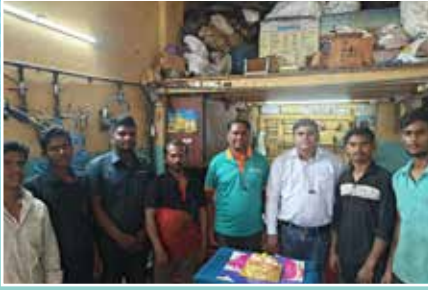
Badshah Honda Service Centre, Solapur (Maharashtra)