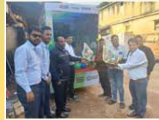
2W डिस्ट्रीब्यूटर - श्री बालाजी ऑटो डिस्ट्रीब्यूटर्स प्रा. लिमिटेड कोलकाता (पश्चिम बंगाल)