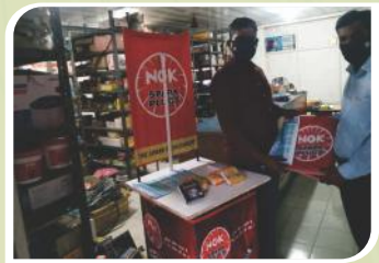
Corner Meet conducted at Ernakulam, Kerala