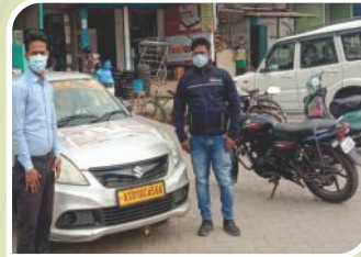
Van Campaign conducted at Assam