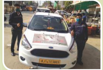
Van Campaign conducted at Rajasthan