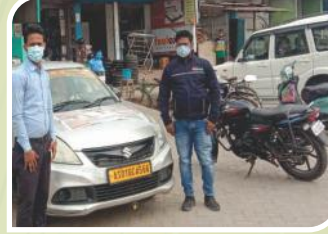
असम में आयोजित वैन कैम्पेन