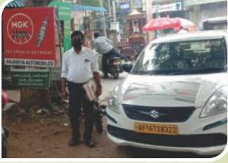
आंध्र प्रदेश में आयोजित वैन कैम्पेन