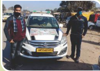
Van Campaign conducted at Haryana