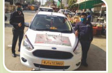
राजस्थान में आयोजित वैन कैम्पेन