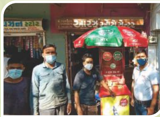
Corner Meet conducted at Anand, Gujarat