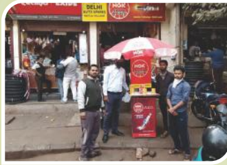
दिल्ली में आयोजित कॉर्नर सम्मेलन