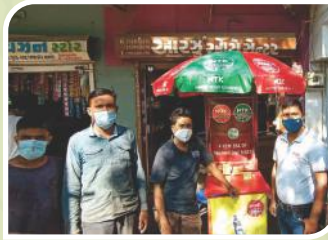
आनन्द, गुजरात में आयोजित कॉर्नर सम्मेलन