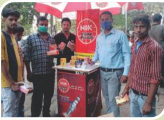
जगदेवपथ, बिहार में आयोजित कॉर्नर सम्मेलन