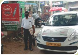
Van Campaign conducted at Andhra Pradesh