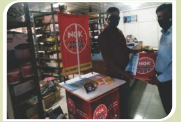
एर्नाकुलम, केरल में आयोजित कॉर्नर सम्मेलन