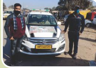
हरियाणा में आयोजित वैन कैम्पेन