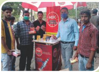
Corner Meet conducted at Jagdepath, Bihar