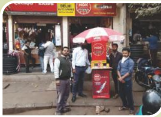
Corner Meet conducted at Delhi