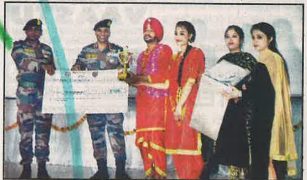
Army officers giving prizes to students who performed on Naushera Day.

During the day-long grievance camp, the Secretary met several deputations from across Kashmir and gave them patient hearing, assuring them that all their genuine issues would be looked into and addressed accordingly. He said that Government was doing its best to address all the grievances of people and also providing them with better service delivery.