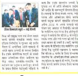
शिमला में ऑटो एक्सपो में नए एनजीके स्पार्क प्लग कारों का प्रदर्शन...