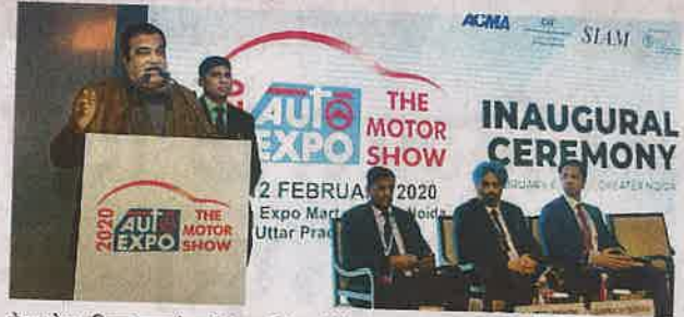
ग्रेटर नोएडा स्थित एक्सपो मार्ट में आयोजित ऑटो एक्सपो 2020 के उद्घाटन समारोह में मौजूद लोगों को संबोधित करते केंद्रीय मंत्री नितिन गडकरी

जागरण संवाददाता, ग्रेटर नोएडा : देश के विकास में सबसे अहम योगदान ऑटोमोबाइल उद्योग का है। सरकार को मिलने वाले राजस्व में भी इस क्षेत्र की अहम भूमिका है। प्रधानमंत्री ने देश को पांच ट्रिलियन डॉलर अर्थव्यवस्था बनाने की बात कही है। इसमें ऑटोमोबाइल क्षेत्र काफी अहम है। आने वाले दिनों में ई-वाहन के निर्माण व निर्यात में विश्व का सबसे बड़ा उद्योग भारतीय ऑटोमोबाइल बनेगा। ये बातें केंद्रीय सड़क परिवहन एवं राजमार्ग मंत्री नितिन गडकरी ने कहीं। वह इंडिया एक्सपो मार्ट में चल रहे ऑटो एक्सपो के उद्घाटन सत्र पर