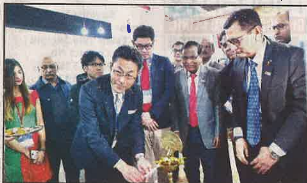
Dignitaries during launch of NGK India's new range of BS-6 ready and BS-6 compliant spark plugs and glow plugs.

As per official spokesman, NGK Group considers the Indian market as one of the most