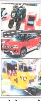
दूसरे दिन इन कंपनियों का गाड़ियां लाव