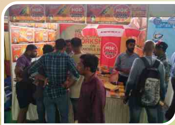
कन्नूर, केरल में आयोजित एसोसिएशन सम्मेलन