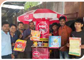
कोल्हापुर, महाराष्ट्र में आयोजित कॉर्नर सम्मेलन