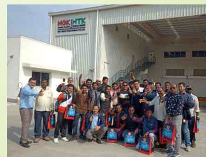
UMC Plant Visit Group II (South & North) 22nd Nov, 2019