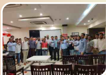
Retailer Meet conducted at Varanasi, Uttar Pradesh