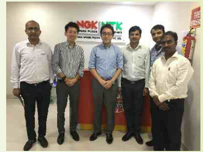
बीएस-6 सेंसर व्यवसाय पर चर्चा करने के लिए यामाहा टीम का एसएमडी कार्यालय दौरा