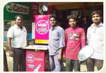
पालवंचा, तेलंगाना में आयोजित कॉर्नर सम्मेलन