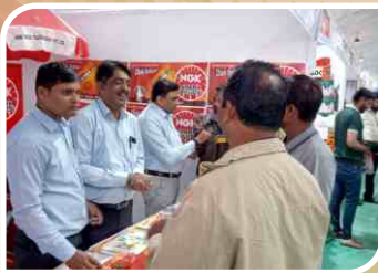
अहमदाबाद, गुजरात में आयोजित एसोसिएशन सम्मेलन