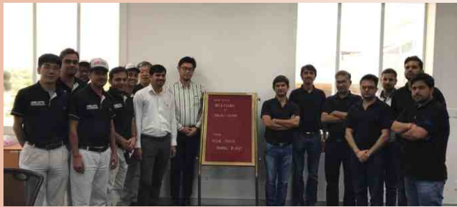
ऑडिट और बड़े पैमाने पर उत्पादन के लिए हमारे बावल प्लांट में बजाज टीम की दौरा

NGK इंडिया, ओईएम समूहों के बीच आपसी सौहार्दपूर्ण संबंध को बढ़ाने के अपने प्रयास के तहत ओईएम को नियमित रूप से अपने बावल प्लांट में आमंत्रित कर रहा है। ओईएम की यह यात्रा NGK और देश के साथ-साथ ग्राहकों के लिए भी समान रूप से फायदेमंद है।