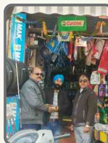
Dasmesh Auto Parts & Service Centre, Bareilly, UP