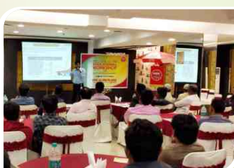
Mechanic Meet conducted at Nagpur, Maharashtra