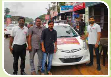
केरल में आयोजित वैन कैम्पेन