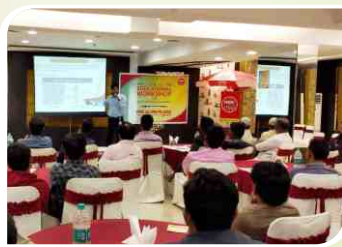
नागपुर, महाराष्ट्र में आयोजित मेकैनिक सम्मेलन