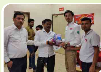
Mechanic Meet with ATS, Japan conducted at Lucknow, Uttar Pradesh