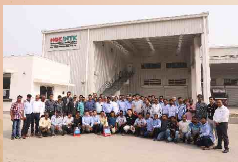
UMC Plant Visit Group I (East & West) 14th Nov, 2019