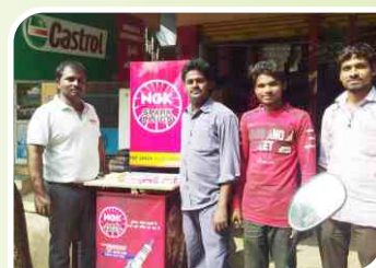
Corner Meet conducted at Palwancha, Telangana