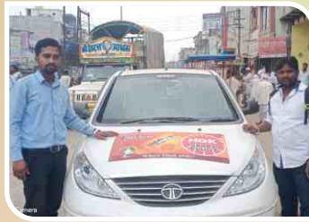
हिंगोली, महाराष्ट्र में आयोजित वैन कैम्पेन