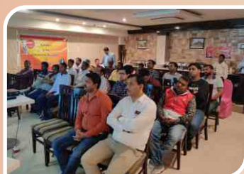
Retailer Meet conducted at Varanasi, Uttar Pradesh