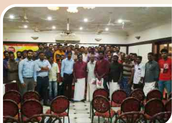
Mechanic Meet conducted at Karunagappalli, Kerala