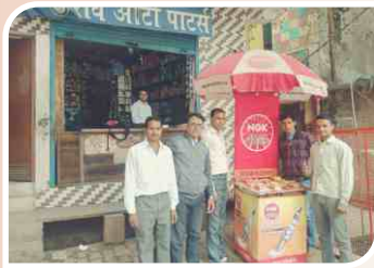
मुरादाबाद, उत्तर प्रदेश में आयोजित कॉर्नर सम्मेलन