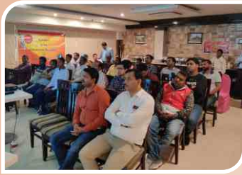
वाराणसी, उत्तर प्रदेश में आयोजित रिटेलर सम्मेलन