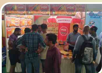
Association Meet conducted at Kannur, Kerala