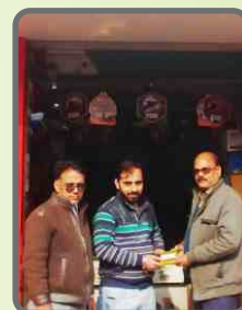
Paras Automobiles Badaun, UP