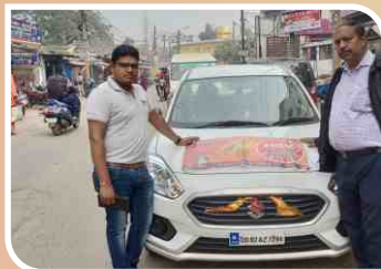
Van Campaign conducted at Cuttack, Odisha