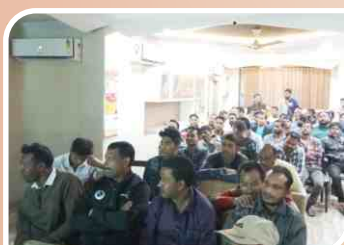
Mechanic Meet conducted at Guwahati, Assam