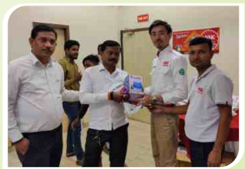
लखनऊ, उत्तर प्रदेश में एटिएस, जापान के साथ आयोजित मेकैनिक सम्मेलन