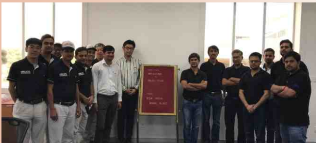
Visit of Bajaj Team to our Bawal Plant for audit and go-ahead for mass production

NGK India in its endeavour to enhance the cordial relationship amongst the OEM fraternity has been regularly inviting OEMs to the Plant at Bawal. These visits by the OEMs are mutually beneficial for NGK, India and the clients also.