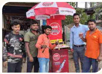
नगाँव, असम में आयोजित कॉर्नर सम्मेलन