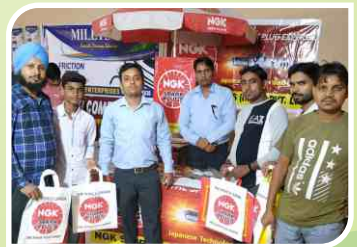
लुधियाना, पंजाब में आयोजित एसोसिएशन सम्मेलन