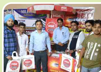
Association Meet conducted at Ludhiana, Punjab