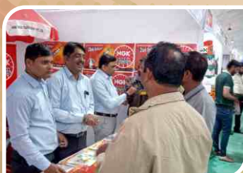
Association Meet conducted at Ahmedabad, Gujarat