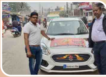
कटक, ओडिशा में आयोजित वैन कैम्पेन