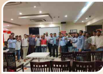
वाराणसी, उत्तर प्रदेश में आयोजित रिटेलर सम्मेलन