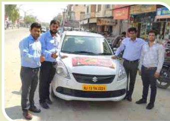
Van Campaign conducted at Jaipur, Rajasthan