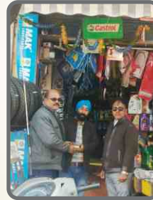
दशमेश ऑटो पार्ट्स एंड सर्विस सेंटर, बरेली, उत्तर प्रदेश