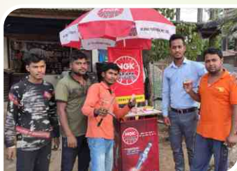
Corner Meet conducted at Nagaon, Assam