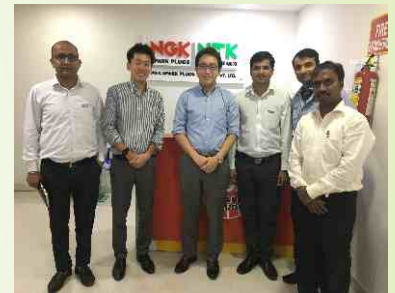
Visit of Yamaha Team to SMD office to discuss regarding BS-6 Sensor business