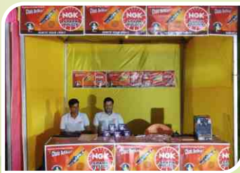
मुम्बई, महाराष्ट्र में आयोजित एसोसिएशन सम्मेलन