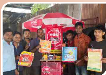
Corner Meet conducted at Kolhapur, Maharashtra