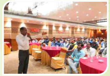
राजकोट, गुजरात में आयोजित रिटेलर सम्मेलन