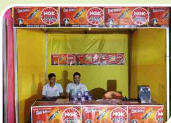
Association Meet conducted at Mumbai, Maharashtra