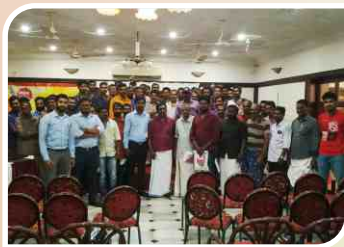
करुनागप्पाली, केरल में आयोजित मेकैनिक सम्मेलन