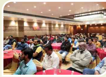
राजकोट, गुजरात में आयोजित रिटेलर सम्मेलन