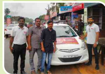
Van Campaign conducted at Kerala