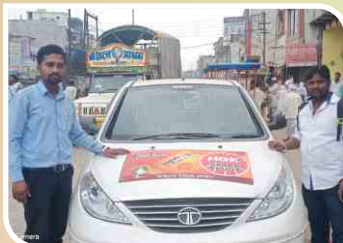
Van Campaign conducted at Hingoli, Maharashtra