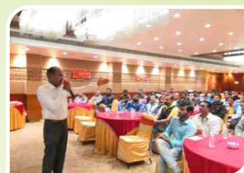
Retailer Meet conducted at Rajkot, Gujarat