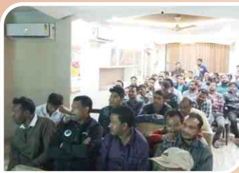
गुवाहाटी, असम में आयोजित मेकैनिक सम्मेलन