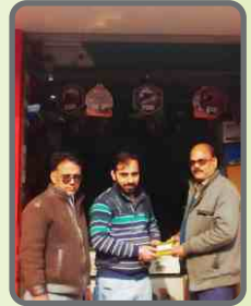
पारस ऑटोमोबाइलस बदायूँ, उत्तर प्रदेश