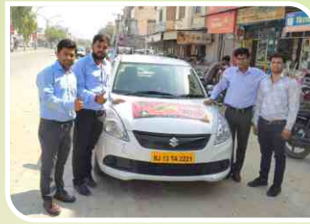
जयपुर, राजस्थान में आयोजित वैन कैम्पेन