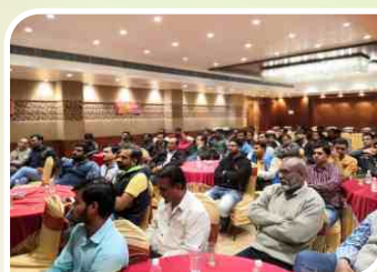
Retailer Meet conducted at Rajkot, Gujarat