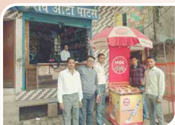
Corner Meet conducted at Moradabad, Uttar Pradesh